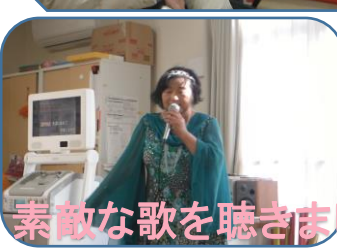
素敵な歌を聴きました♪