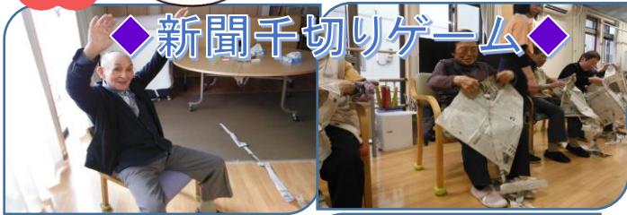
◆新聞千切りゲーム◆