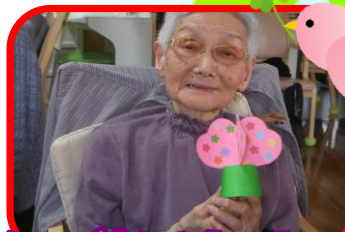
桜が満開に咲いたよ♪