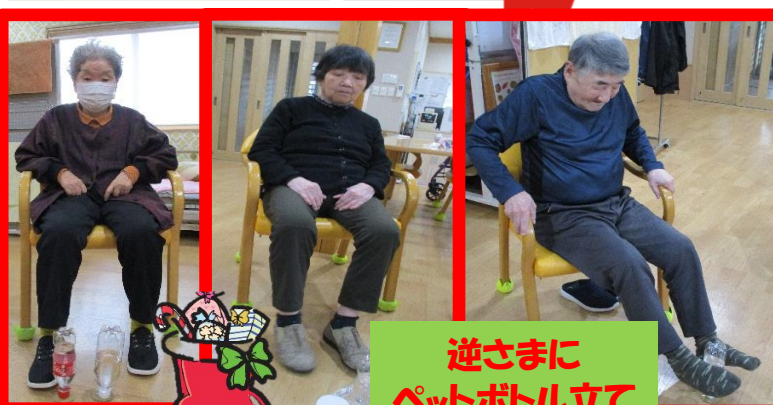
逆さまに ペットボトル立て

編集後記 ご要望・ご質問がございましたらお気軽にご連絡下さい。 ☆毎週 金曜日ブログ更新中です