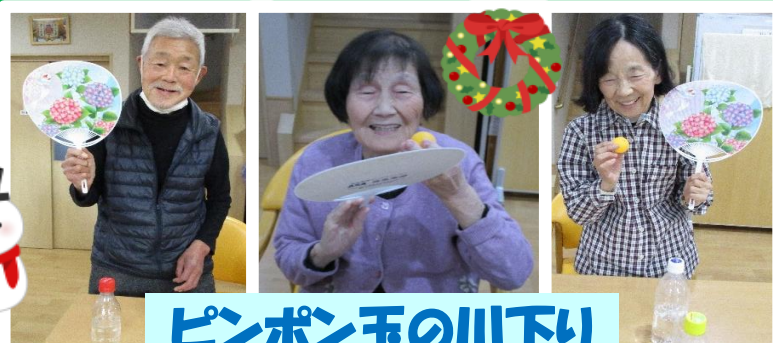
ピンポン玉の川下り